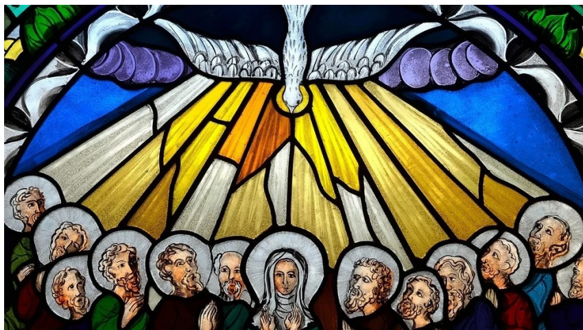
Glas-in-lood afbeelding van Pinksteren, Hoogfeest 5 juni

DEEL VAN DE R.K. PAROCHIE NICOLAAS PIECK EN GEZELLEN