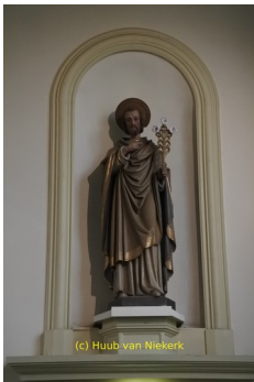
Foto: beeld in onze kerk van de H. Jozef

Van internet : Van de Heilige Jozef weten we niet meer dan wat het Nieuwe Testament van hem mededeelt, met name in het zogenaamde kindsheids-evangelie. Zo kennen wij hem alleen in de context van Jezus' geboorte en kinderjaren: gewetensvol ten opzichte van haar die hij tot echtgenote heeft gekozen, zich bewust van zijn vaderlijke plicht met betrekking tot Jezus. Daarom kenmerkt het Evangelie hem als rechtvaardig of rechtschapen, d.w.z. als trouw in zijn